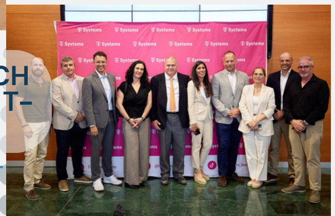
CELEBRACIÓN 1.000 EMPLEADOS T- SYSTEMS