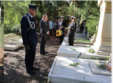
ENGLISCHER FRIEDHOF CEMENTERIO INGLÉS