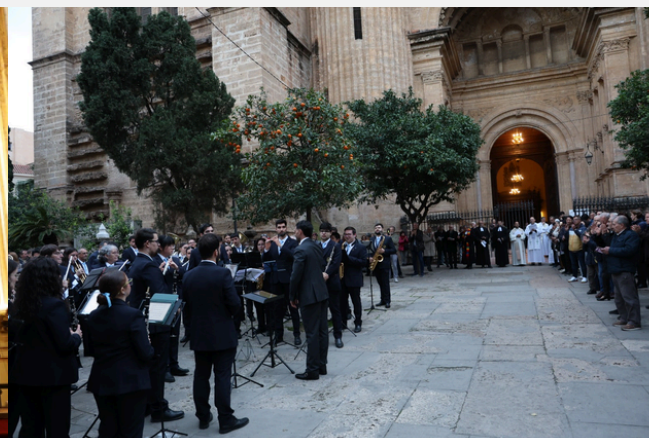
ÖKUMENISCHER DIENST SERVICIO ECUMÉNICO RELIGIOSO