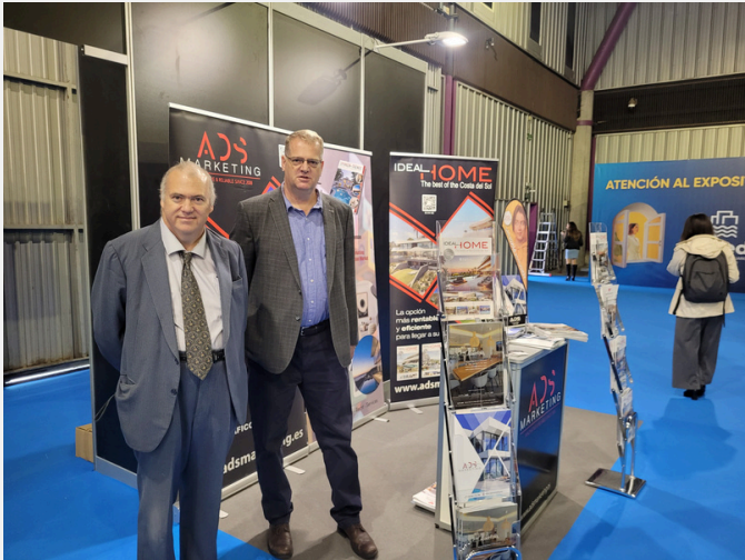
BESUCH DER SIMED- MESSE. STAND ADS MARKETING