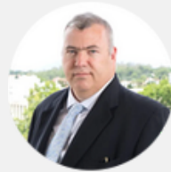
FERNANDO FRÜHBECK PRÄSIDENT