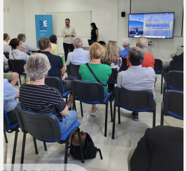
UNTERSTÜTZUNG DES DEUTSCHEN UNTERNEHMENS CAMPORO