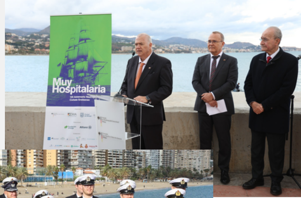
PASEO DE LEVANTE