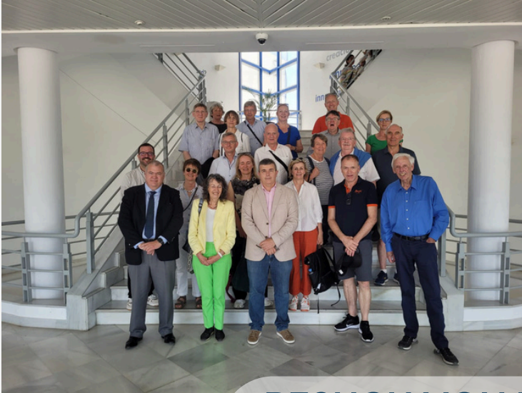
BESUCH VON RC KARLSRUHE VISITA RC KARLSRUHE