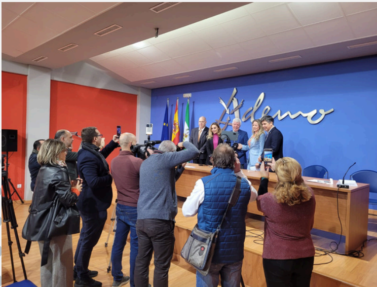
VERANSTALTUNG ANLÄSSLICH VON 1.000 MITARBEITERN IN T- SYSTEMS